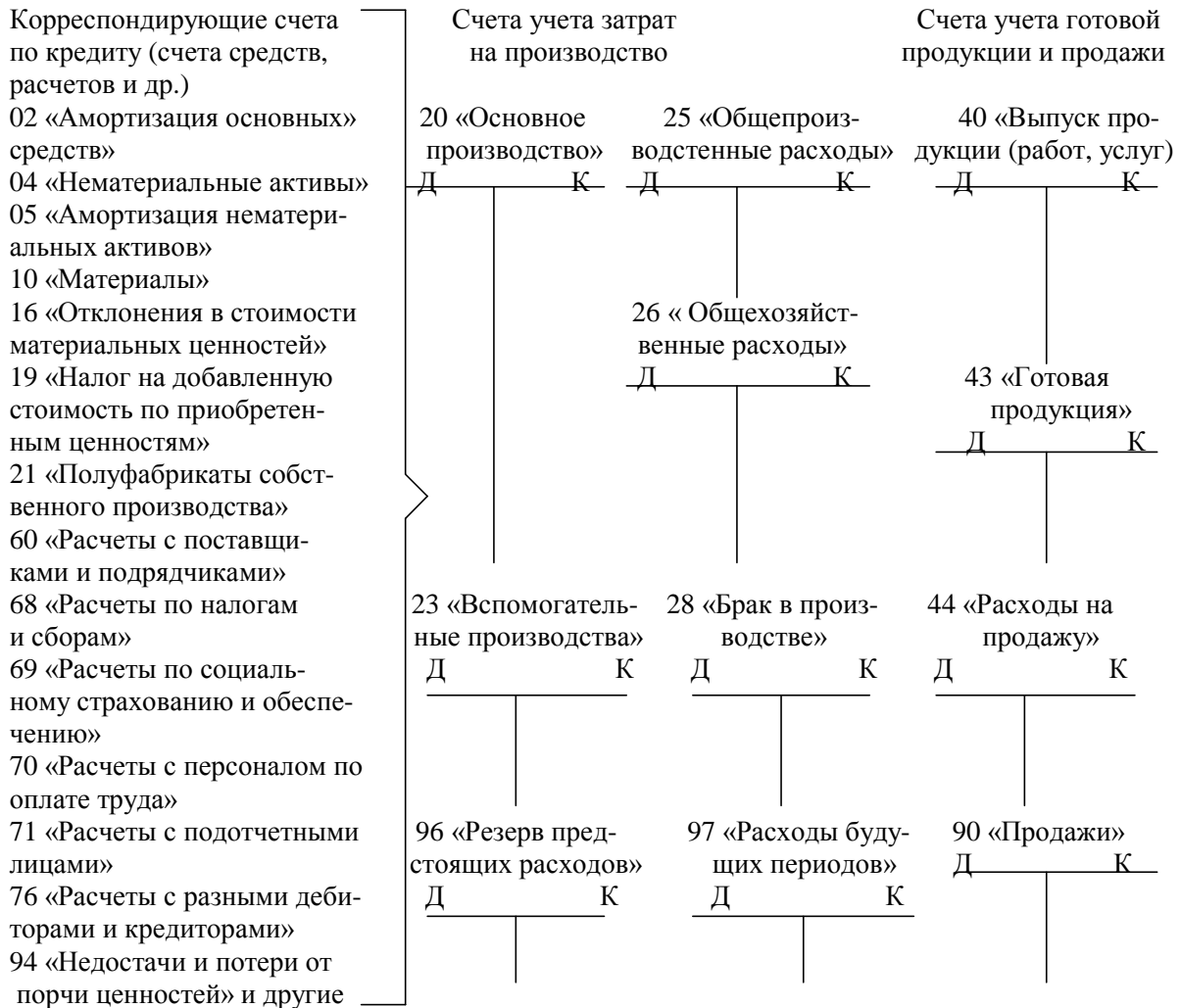
Схема учета производства