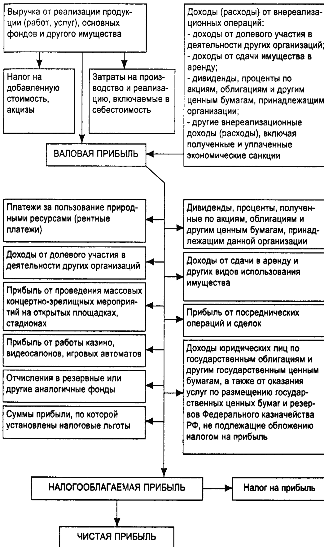
Рис.2 Схема образования и распределения прибыли