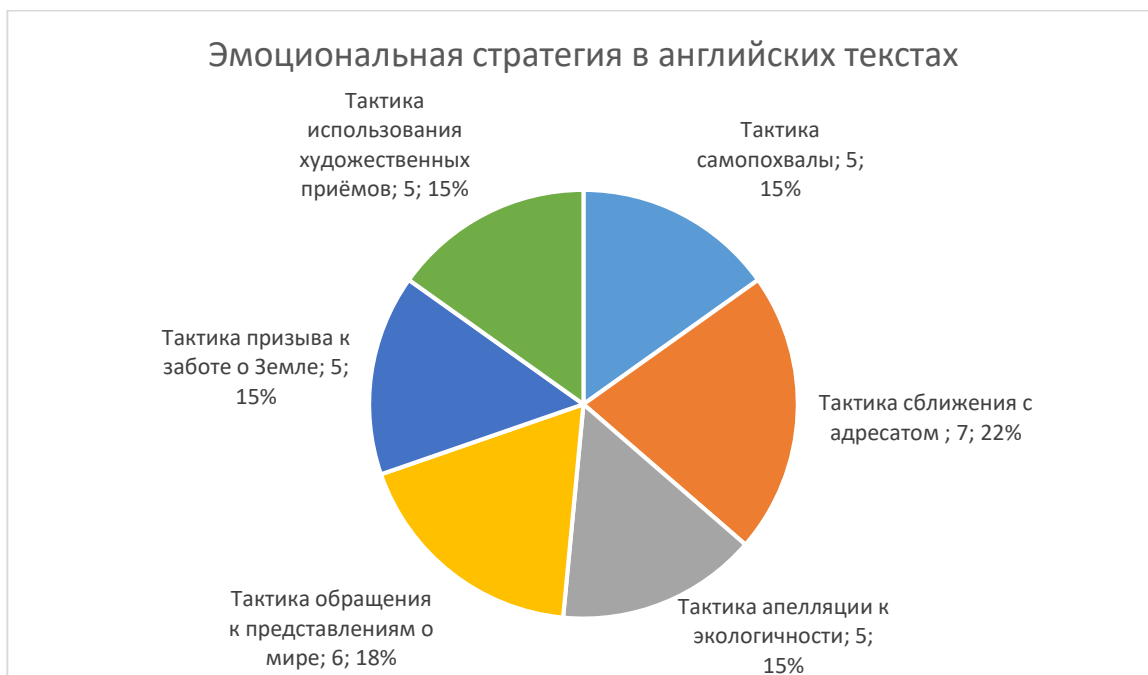
Рис. 2. Реализация тактик эмоциональной стратегии в англоязычных текстах.