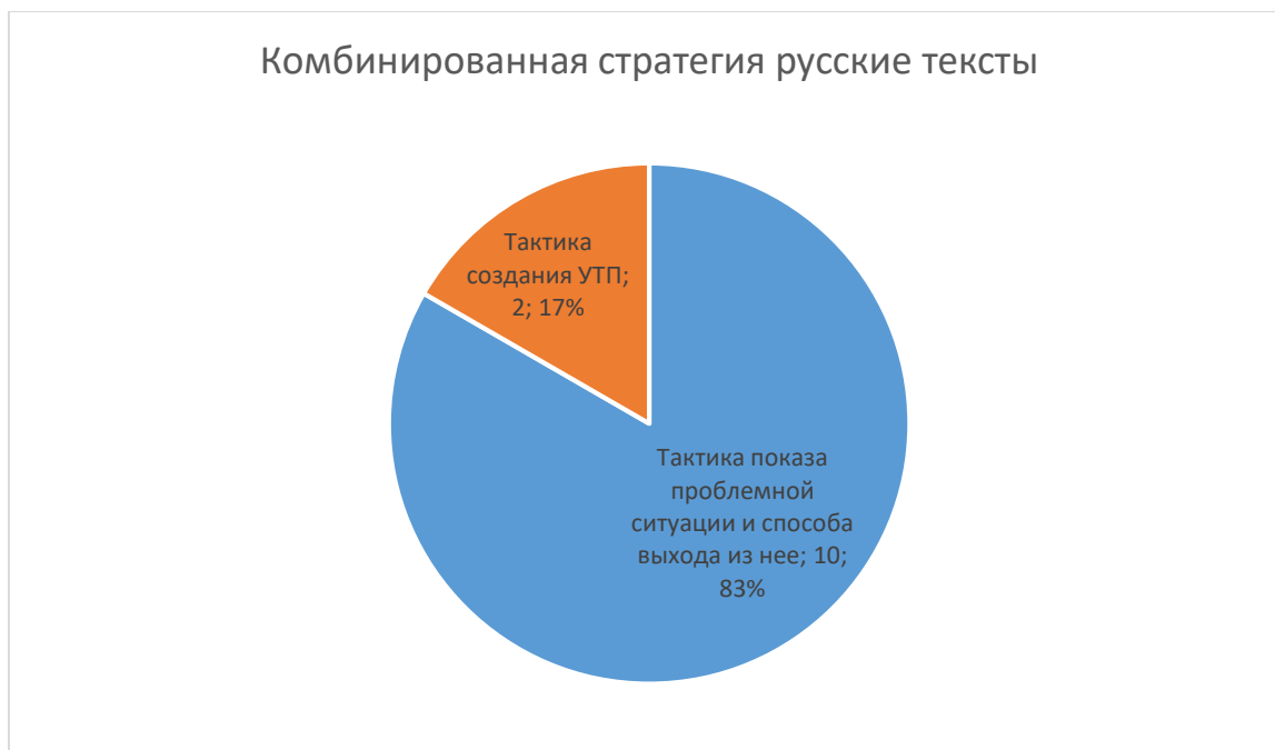
Рис. 5. Реализация тактик комбинированной стратегии в русскоязычных текстах.