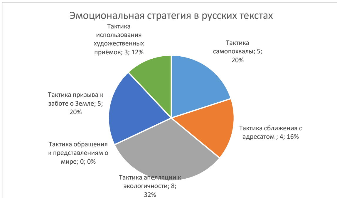
Рис. 1. Реализация тактик эмоциональной стратегии в русскоязычных текстах.

В графическом виде данные представлены на рис. 1 и рис. 2.