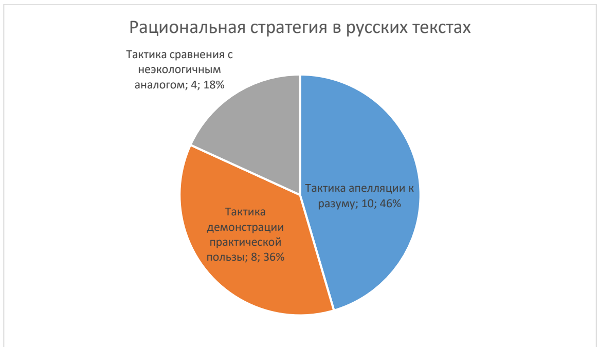
Рис. 3. Реализация тактик рациональной стратегии в русскоязычных текстах.